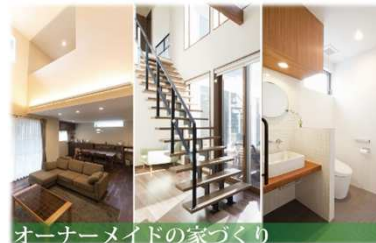
オーナーメイドの家づくり

【建設業許可】福岡県知事許可(般-13)第95092号 【宅建業許可】福岡県知事(5)第10558号 福岡県宅地建物取引業協会会員