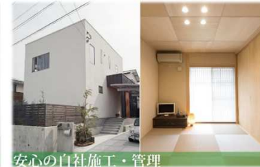
安心の自社施工・管理